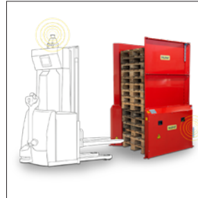
Vorbereitet für AGV 15 Paletten / 500 kg