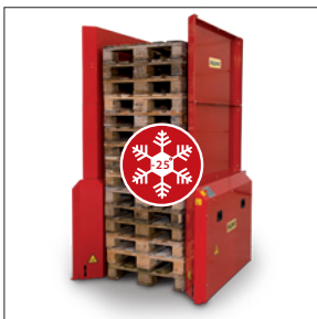
Palettenhandhabung in kalter Umgebung bis zu -25°C. (PALOMAT® Greenline 15 Paletten / 500 kg.)