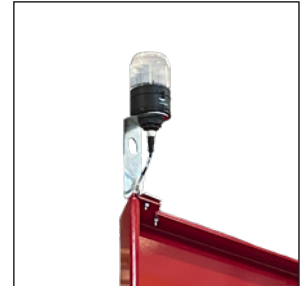
Lichtmast inkl. Max-Melder