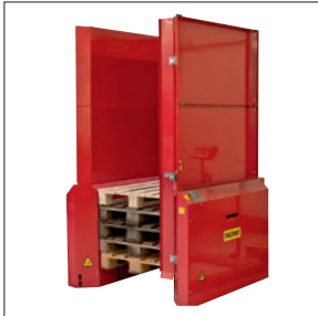
Sicherheitsabschrnkung mit Tür für 15 Paletten

VOLLSTÄNDIG AN IHRE BEDÜRFNISSE ANGEPASST