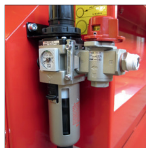
Absperrventil (Nur für Luft-Modelle)