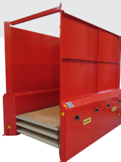
■ Kundenspezifisch für Plattformen 2400x1200x160 mm