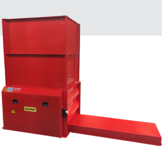
■ PALOMAT® mit Kundenspezifisch safety box