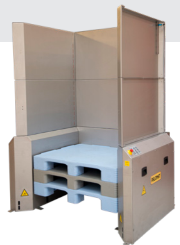
■ Kundenspezifisch für Paletten 1060x750x175 mm