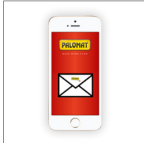
Vorbereitet für Information via SMS / E-mail